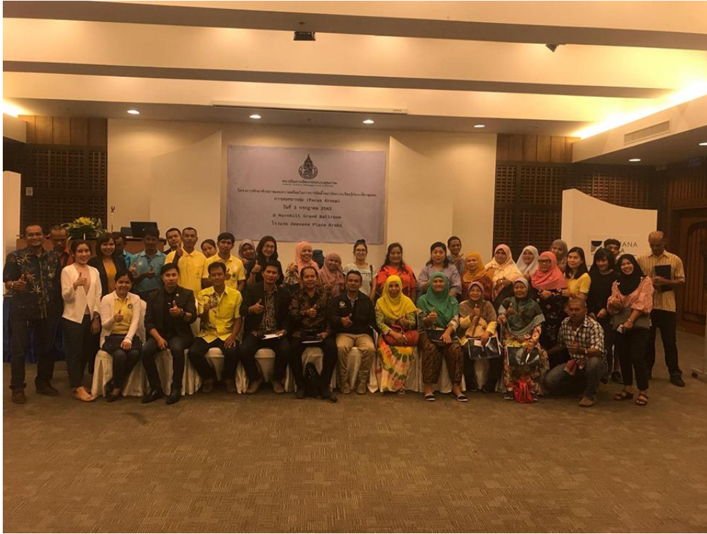
ภาพกิจกรรมการสนทนากลุ่ม (Focus Group) การรวมกลุ่มเครือข่ายกลุ่ม