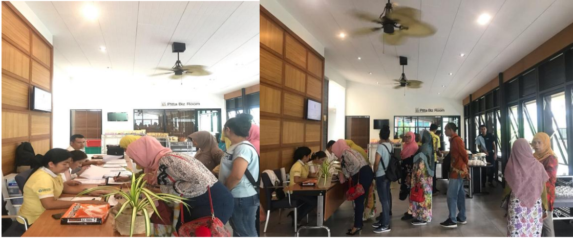
ภาพการลงทะเบียน และการต้อนรับผู้เข้าร่วมการสนทนากลุ่ม (Focus Group)