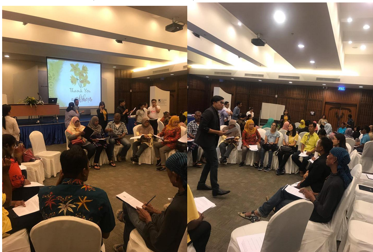
ภาพกิจกรรมการนำเสนอประเด็นการสนทนากลุ่ม (Focus Group) และบันทึกข้อมูล