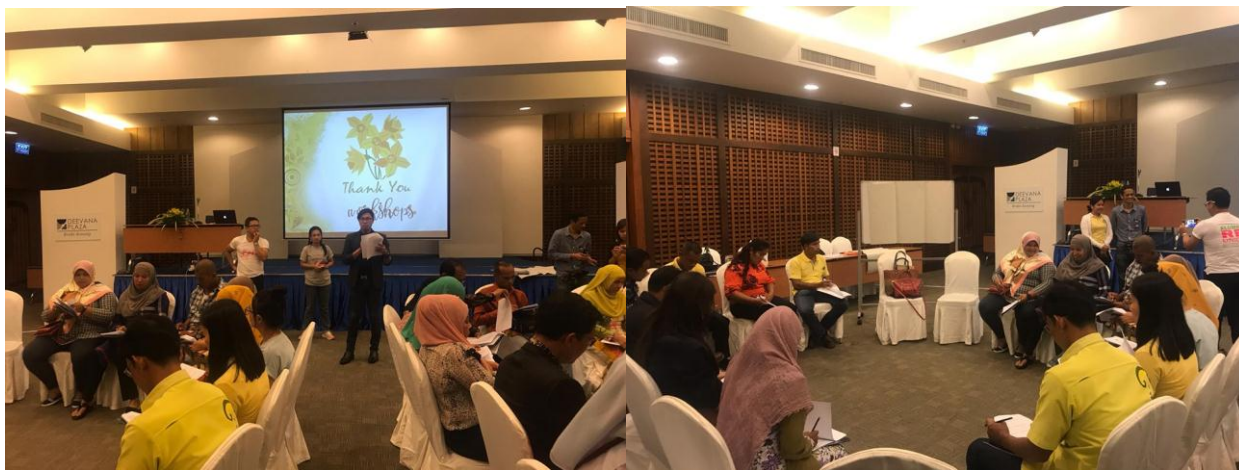
ภาพกิจกรรมการสนทนากลุ่ม (Focus Group) จาก 2 กลุ่มย่อย