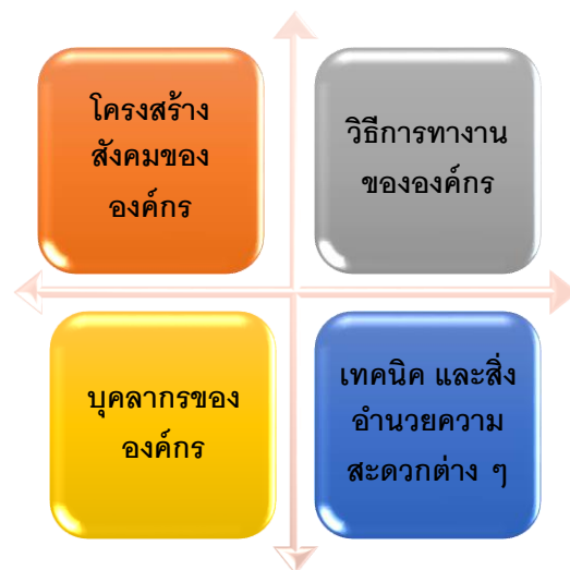
ภาพที่ 1: ปัจจัยนำเข้าสู่การปรับเปลี่ยนและผลผลิต

1) ปัจจัยนำเข้า (Input) ซึ่งมีปัจจัยอยู่ 4