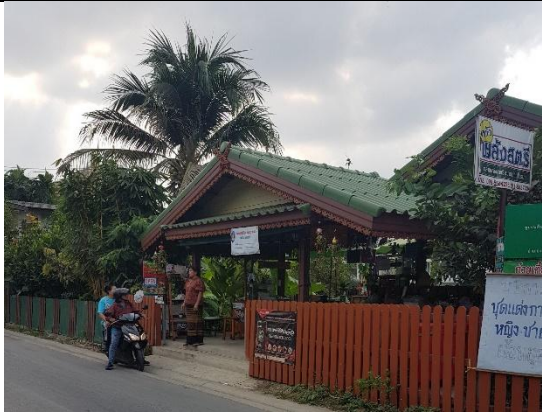
หน้าร้าน