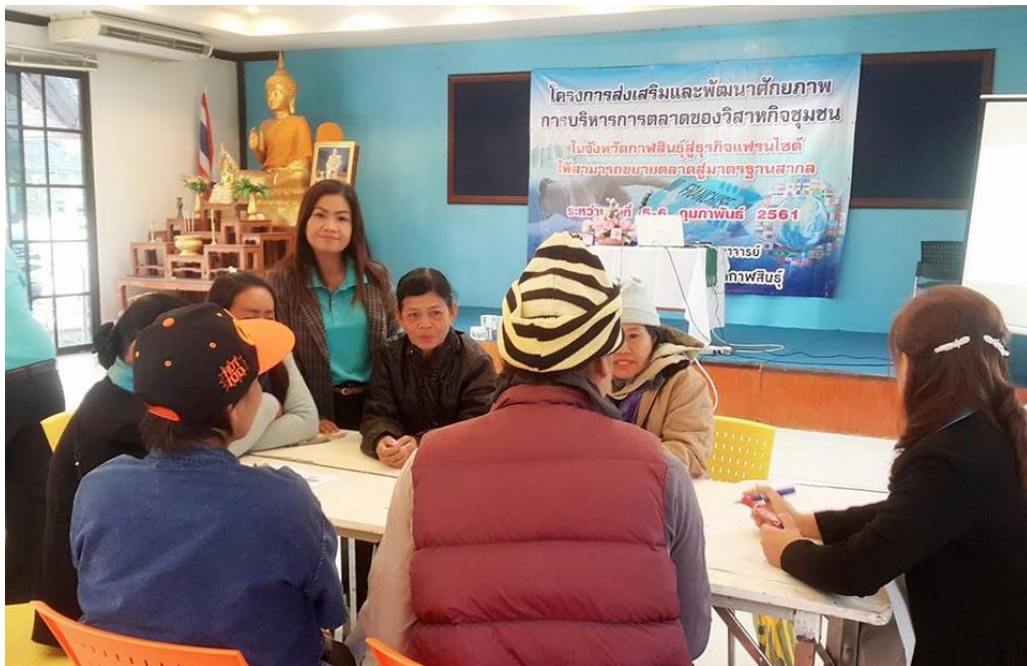
ภาพที่ 3.14 บรรยายภาคการอบรมโครงการ