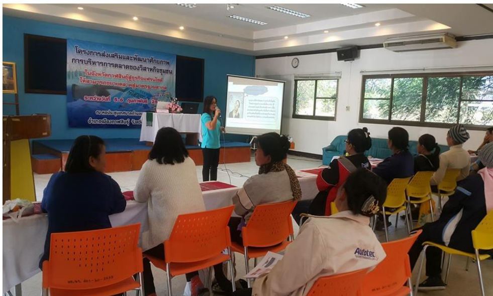
ภาพที่ 3.6 บรรยายภาคการอบรมโครงการ