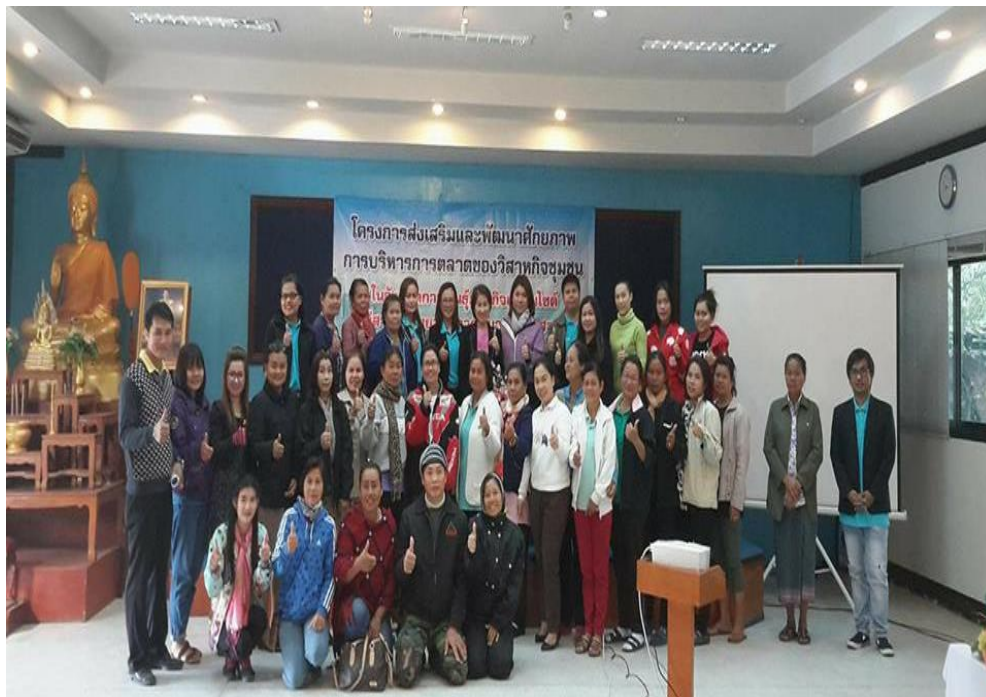
ภาพที่ 3.17 ถ่ายภาพรวมผู้เข้าร่วมโครงการ