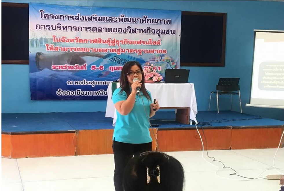
ภาพที่ 3.5 บรรยายภาคการอบรมโครงการ