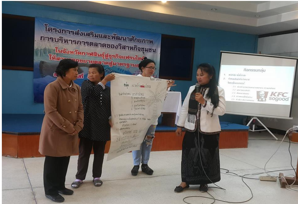
ภาพที่ 3.13 บรรยายภาคการอบรมโครงการ