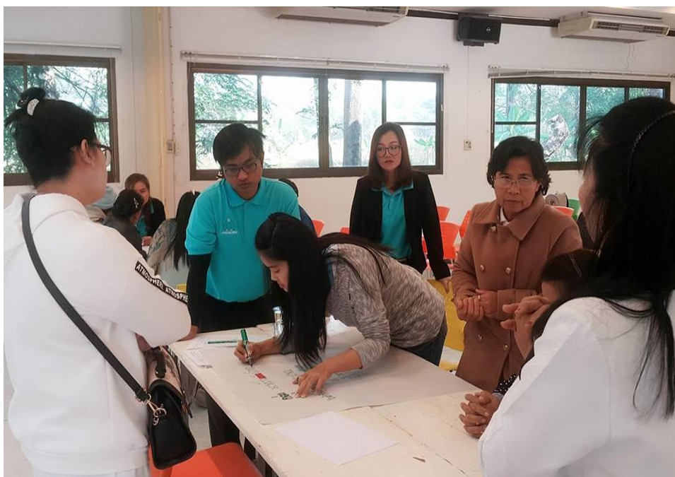
ภาพที่ 3.16 บรรยายภาคการอบรมโครงการ