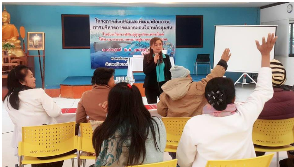
ภาพที่ 3.9 บรรยายภาคการอบรมโครงการ