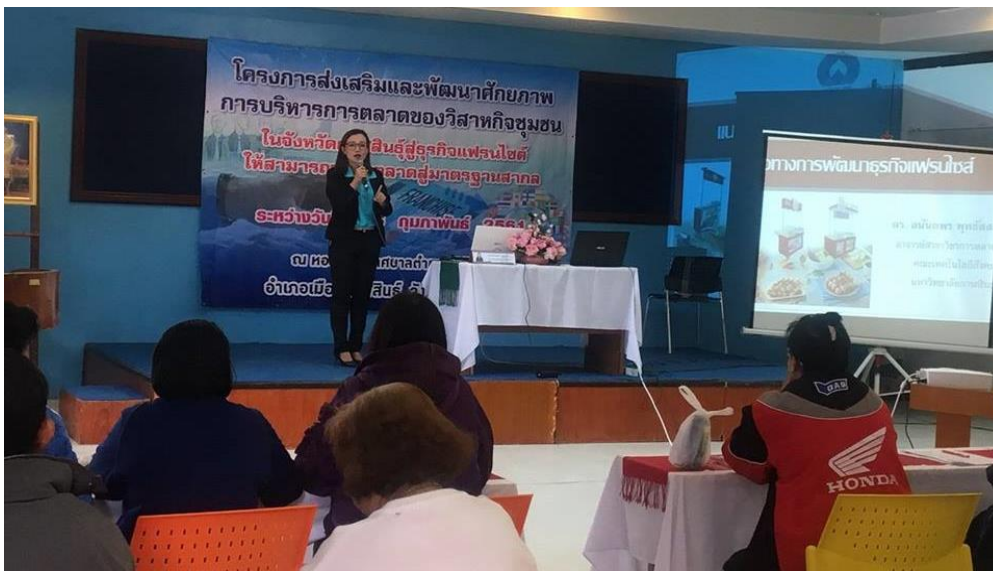
ภาพที่ 3.8 บรรยายภาคการอบรมโครงการ