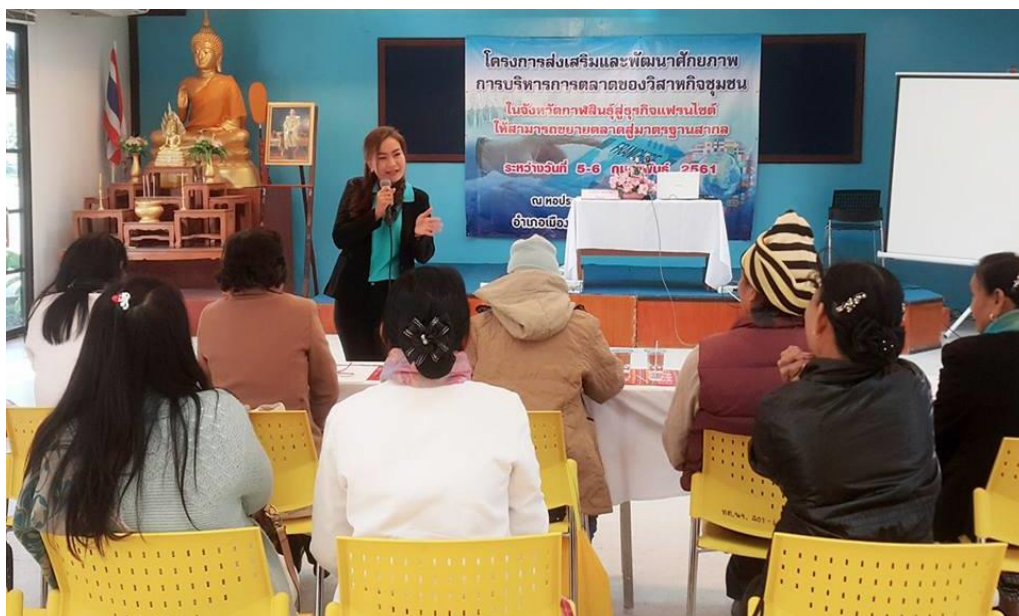
ภาพที่ 3.10 บรรยายภาคการอบรมโครงการ