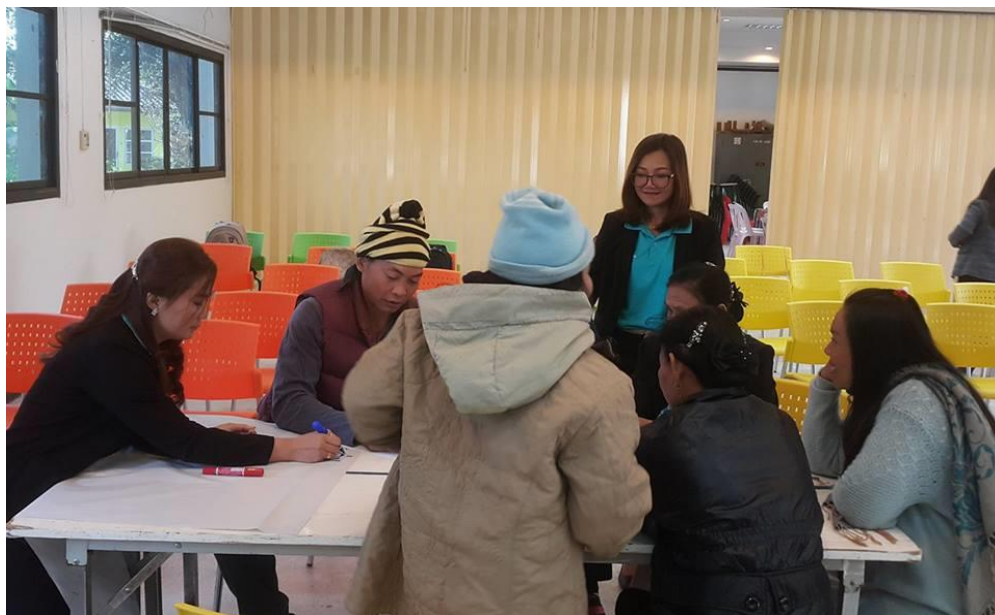
ภาพที่ 3.11 บรรยายภาคการอบรมโครงการ