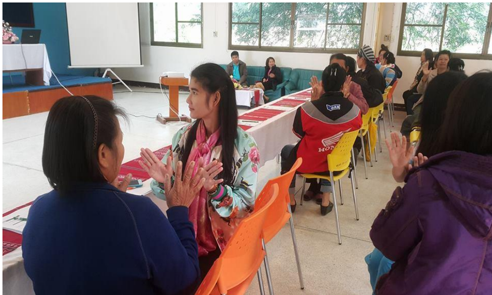
ภาพที่ 3.7 บรรยายภาคการอบรมโครงการ