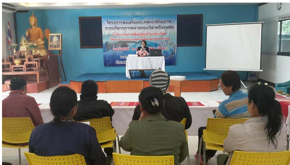
ภาพที่ 3.1 คณะบดีคณะเทคโนโลยีสังคม กล่าวเปิดโครงการ