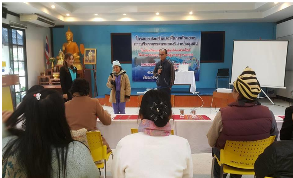
ภาพที่ 3.12 บรรยายภาคการอบรมโครงการ