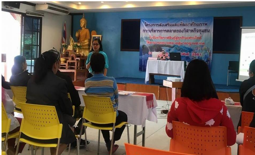
ภาพที่ 3.3 บรรยายภาคการอบรมโครงการ