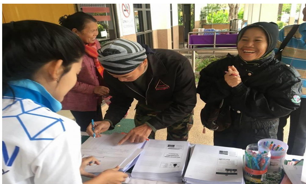
ภาพที่ 3.2 การลงทะเบียนผู้เข้าร่วมอบรมโครงการ