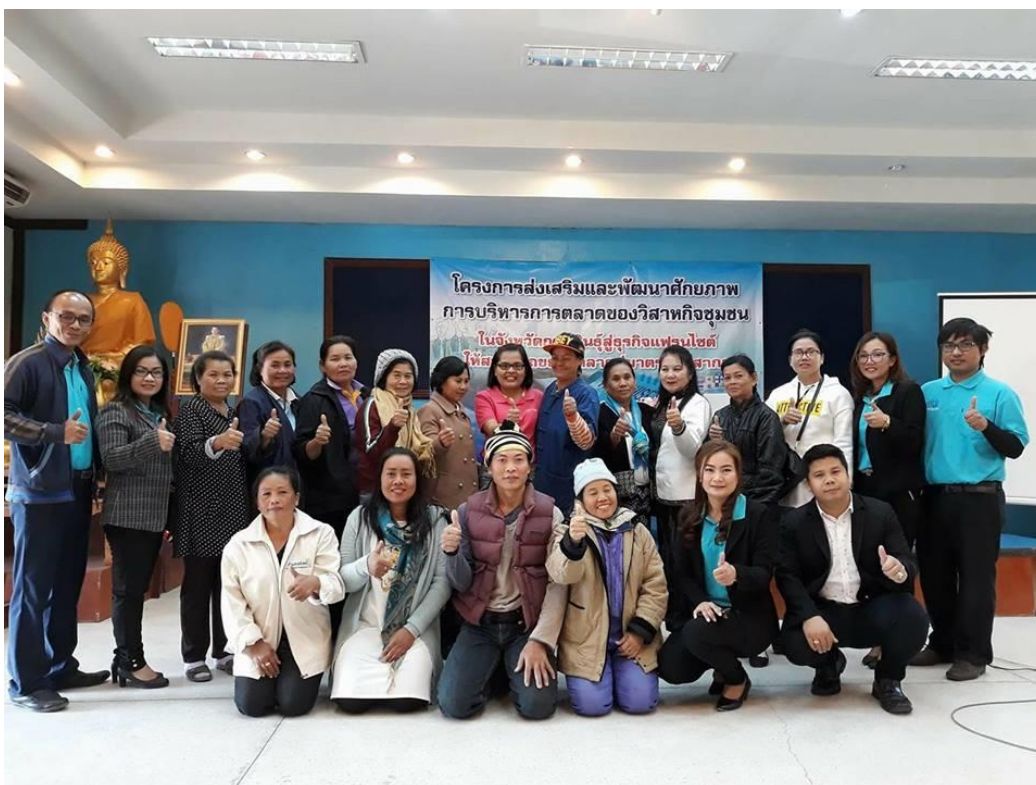
ภาพที่ 3.18 ถ่ายภาพรวมผู้เข้าร่วมโครงการ