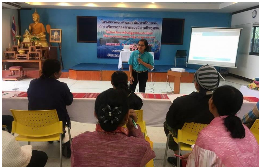
ภาพที่ 3.4 บรรยายภาคการอบรมโครงการ