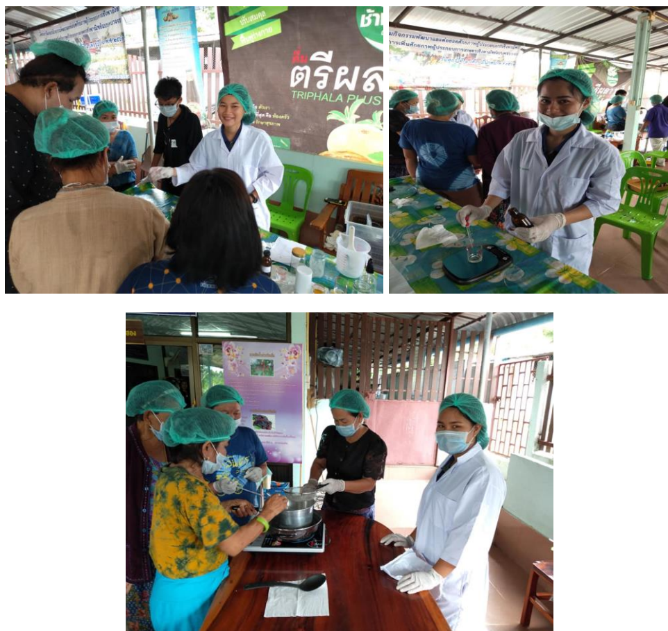
ภาพที่ 3.3 นักศึกษาสาขาวิทยาศาสตร์สุขภาพและความงาม สาขาการแพทย์แผนไทย ราชมงคลีसान สกลนคร ทำหน้าที่เป็นผู้ช่วยวิทยากรในการสอนการทำโลชั่นให้กับชาวบ้าน