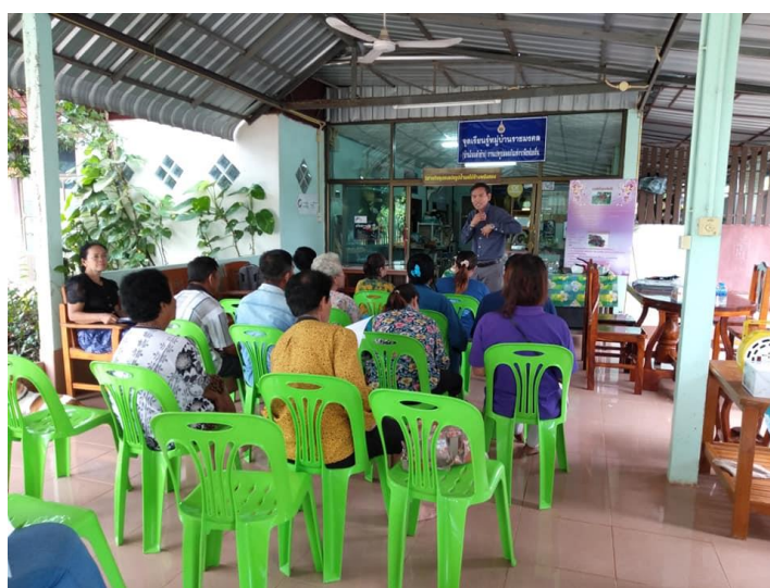
ภาพที่ 3.2 ชาวบ้านผู้เข้าอบรมการพัฒนาโลชั่นผิวขาวจากสารสกัดใบเเม่ ให้ความสนใจและตั้งใจฟังการบรรยายเป็นอย่างดี