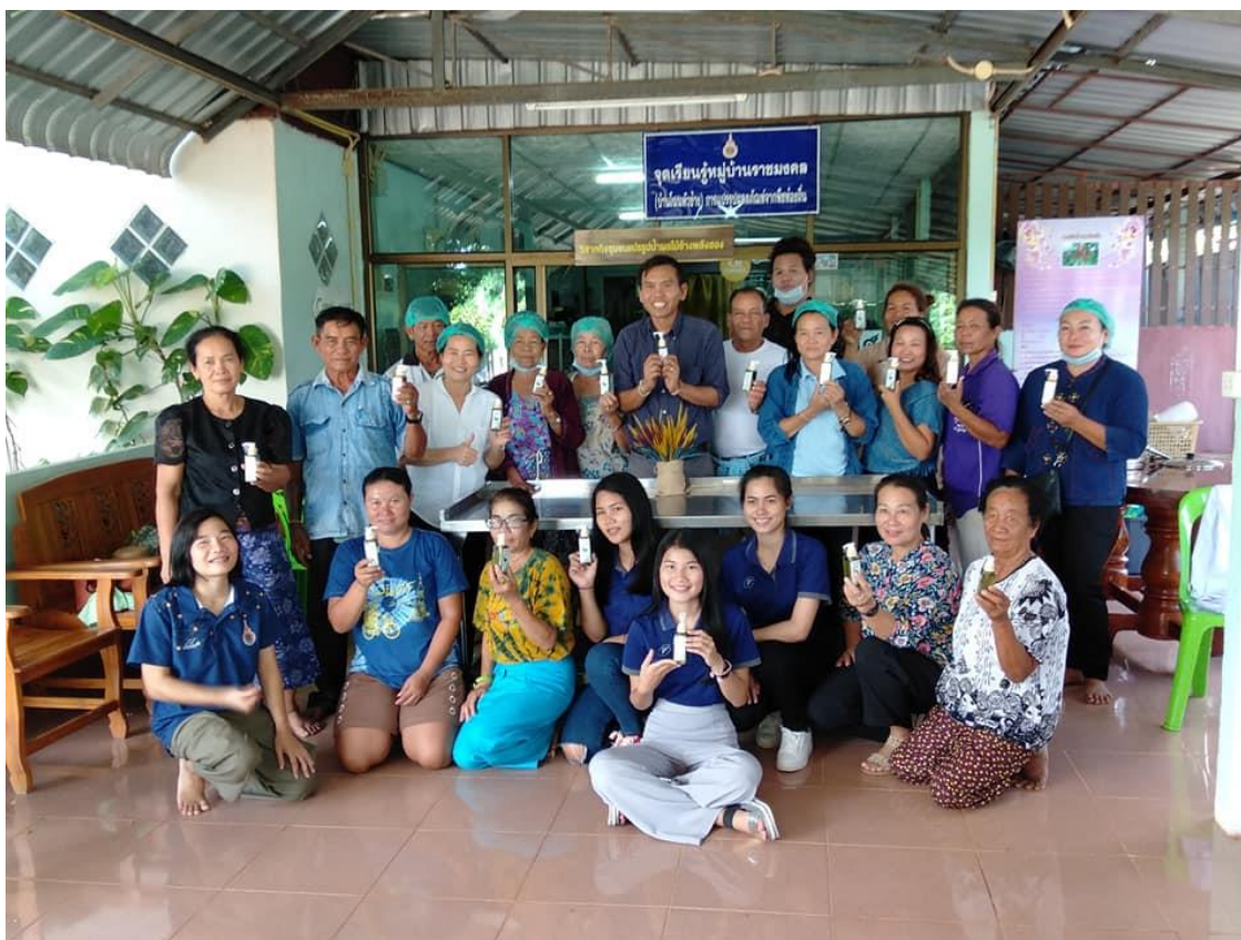
ภาพที่ 3.96 ภาพที่ระลึกทีมวิทยากรจากมหาวิทยาลัยเทคโนโลยีราชมงคลอีสาน วิทยาเขตสกลนคร และชาวบ้านในกลุ่มวิสาหกิจชุมชนแปรรูปน้ำผลไม้ข้างพลังสอง จังหวัดสกลนคร ซึ่งผู้เข้ารับการฝึกอบรมและถ่ายทอดเทคโนโลยีจะได้รับโลชั่นผสมสารสกัดใบเม่าเข้มข้นกลับบ้านคนละ 1 ขวด