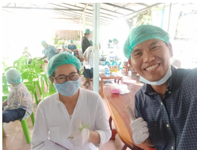
ภาพที่ 3.4 ถ่ายภาพคู่กับประธานวิสาหกิจชุมชนแปรรูปน้ำผลไม้ บ้านโนนหัวช้าง ซึ่งให้เกียรติเข้าร่วมการ อบรมการทำโลชั่นด้วยความตั้งใจ