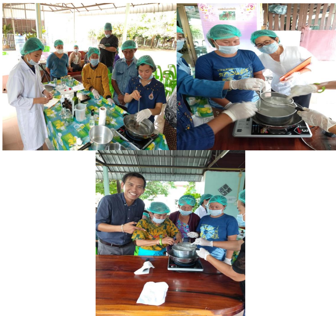
ภาพที่ 3.6 ชาวบ้านช่วยกันผสมสารเคมีตามสัดส่วนของสูตรทำโลชั่นแล้วผสมกับสารสกัดใบเม้าที่ได้