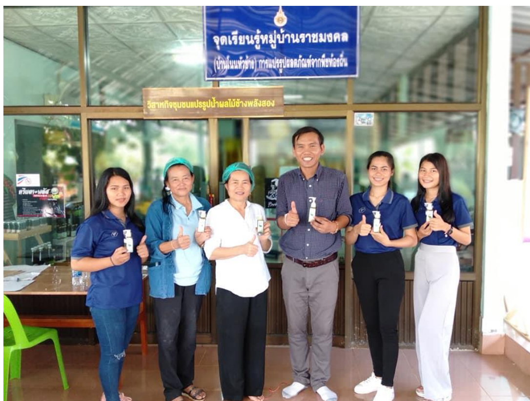
ภาพที่ 3.8 แสดงความยินดีหลังทำผลิตภัณฑ์โลชั่นเสร็จสิ้นแล้วระหว่างทีมวิทยากรจากมหาวิทยาลัย เทคโนโลยีราชมงคลอีสาน วิทยาเขตสกลนคร และประธานกลุ่มวิสาหกิจชุมชนแปรรูปน้ำผลไม้ข้างพลังสอง จังหวัดสกลนคร