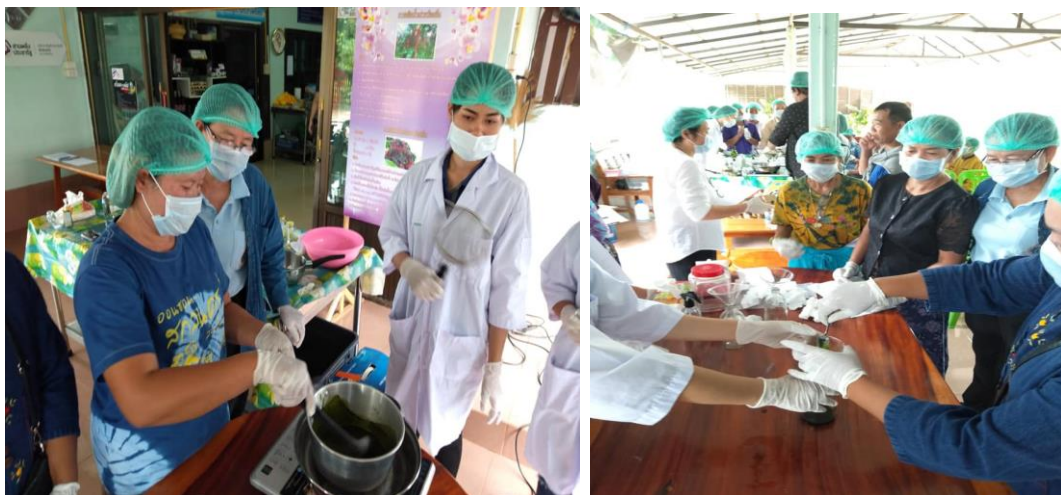
ภาพที่ 3.5 ชาวบ้านที่เข้าอบรมช่วยกันสกัดสารสำคัญจากใบเม้าด้วยการตุ๋น ซึ่งเป็นขั้นตอนที่สามารถทำได้ในครอบครัว