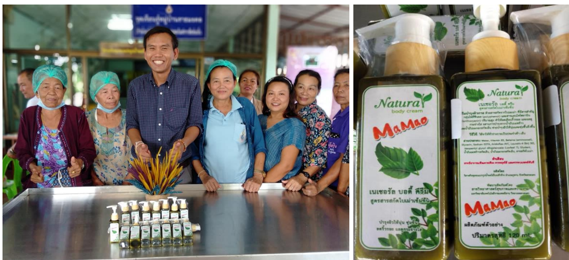
ภาพที่ 3.7 ภาพขวดโลชั่นผสมสารสกัดโสมเข้มข้นที่มีการติดฉลากของกลุ่มวิสาหกิจชุมชน และบรรจุภัณฑ์ อย่างดีด้วยท่อพลาสติกใส