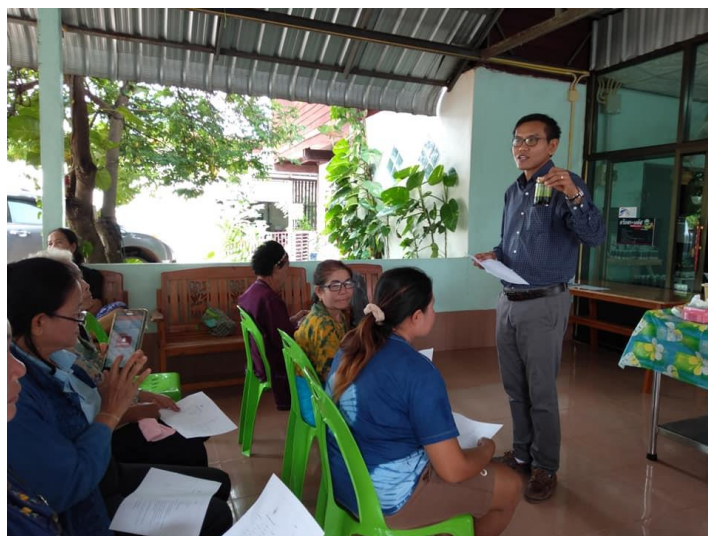
ภาพที่ 3.1 การบรรยายในช่วงเช้าเรื่องการสกัดสารสำคัญออกจากใบเเม่ ให้กับชาวบ้านผู้เข้าอบรม