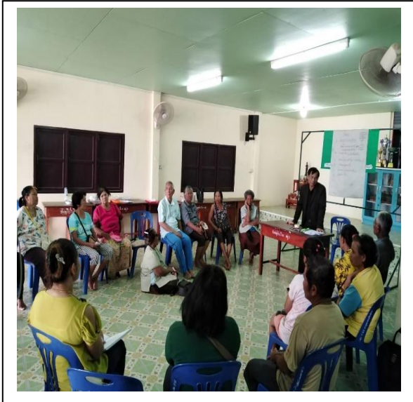
วิเคราะห์โครงสร้างक्रमยากรทุน ครัวเรือน และ วิเคราะห์รายรับ-จ่าย ครัวเรือนเป้าหมาย