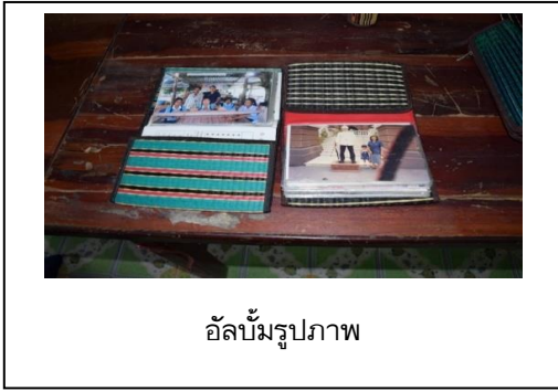
อัลบั้มรูปภาพ