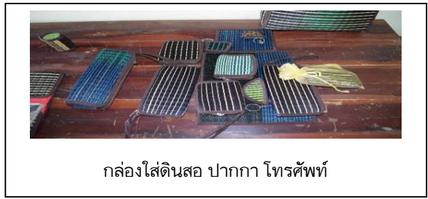
กล่องใส่ดินสอ ปากกา โทรศัพท์