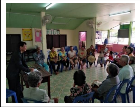
วัตถุประสงค์ เพื่อพัฒนาต่อขยดผลิตภัณฑ์เลือกให้ กลุ่มเป้าหมายมีรายได้เพิ่มขึ้น กลุ่มเป้าหมาย สมาชิกกลุ่มผลิตภัณฑ์เลือกผู้สูงอายุบ้าน ตลอดสืบสัน จำนวน 10 ครัวเรือน 36 คน

ชุมชนบ้านคลองสีบสาย หมู่ที่ 3 ตำบลเขาทรายสีบ อำเภอเขาฉกรรจ์ จังหวัดสระแก้ว เป็นชุมชนเกษตรกรรมทำนาเป็นหลักได้รับการยกระดับเป็นชุมชนวิถีชีวิตคาวบอยโดดเด่นด้านประเพณี ปลายตรีสู่ขวัญข้าว ชาวบ้านทุกคนรักและหวงแหนจากเก็บเกี่ยวผลผลิตจะจัดประเพณีปลายตรี-สู่ขวัญ ข้าว โดยมีพิธีกรรมบูชาพระแม่โพสพ เป็นสำคัญ ด้านวิถีดำรงชีพ ชาวบ้านมีกระท่อมไม้สัก ภายนอก เป็นสีส้มเพื่อใช้เก็บของในชุมชน และถาดไม้ในชุมชน ต่อมาได้เข้ามาเลือกขยาธูปเป็นผลิตภัณฑ์สร้างราย เสริมในครัวเรือนหลังจากทำนา เช่น กระเป๋าใส่โทรศัพท์ เป็นต้น จากการลงพื้นที่สำรวจข้อมูลชุมชน พบว่า ผลิตภัณฑ์เลือก เช่น ถาดไม้เลือกมีชื่อเสียงและได้รับการยอมรับ และได้รวมตัวกัน จัดตั้งเป็นกลุ่มผลิตภัณฑ์เลือกกลุ่มผู้สูงอายุบ้านคลองสีบสาย ทำให้มีหน่วยงานต่างๆเข้ามาสนับสนุน อย่างต่อเนื่อง เช่น สหกรณ์ออมทรัพย์และเปลี่ยนแปลงได้ส่งผลให้คาวบอยวิถีชีวิตเลือกลดลงจำหน่าย ได้ดียิ่งขึ้น ส่งผลกระทบต่อรายได้และคุณภาพชีวิตของสมาชิกเป็นอย่างมาก ดังนั้น จึงมีคาวบอย ต้องการพัฒนาต่อขยดผลิตภัณฑ์เลือกด้านถาดไม้ รูปแบบ และตราผลิตภัณฑ์เลือก ต่อไป