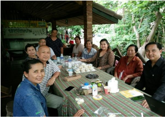
เยี่ยมชมครัวเรือนสร้างแรงบันดาลใจ/ตรวจสอบความมุ่งมั่นในการดำเนินกิจกรรมพัฒนา/แก้ไขปัญหาาร่วมกัน