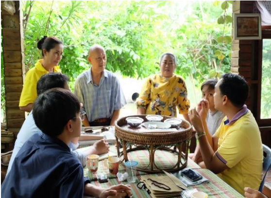
ฝึกอบรมเสริมสร้างความรู้และทักษะด้านเทคโนโลยีบรรจุภัณฑ์ การเลือกใช้และการออกแบบภาชนะบรรจุผลิตภัณฑ์กალะแมให้แก่มแม่บ้าน