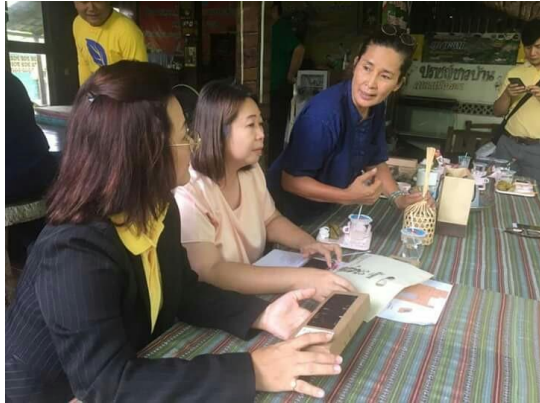
ฝึกอบรมเสริมสร้างความรู้และทักษะด้านการพัฒนาเทคนิคการประชาสัมพันธ์ และสร้างแผนการตลาดของผลิตภัณฑ์กალะแมให้แก่มแม่บ้าน