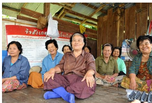
ภาพที่ 1 สังคมผู้สูงอายุ ในปี 2560

การคาดประมาณประชากรของประเทศไทย พ.ศ. 2553 -2583 กลุ่มผู้สูงอายุวัยกลางและวัยปลายมีแนวโน้มเพิ่มสูงขึ้นสะท้อนถึงภาระค่าใช้จ่ายด้านสุขภาพที่เพิ่มมากขึ้นขณะที่ผู้สูงอายุจำนวนมากยังมีรายได้ไม่เพียงพอในการยังชีพผู้สูงอายุมีแนวโน้มเพิ่มขึ้นจาก 10.3 ล้านคน (ร้อยละ 16.2) ในปี 2558 เป็น 20.5 ล้านคน (ร้อยละ 32.1) ในปี พ.ศ. 2583 การเพิ่มขึ้นของผู้สูงอายุวัยกลางและวัยปลายจะส่งผลกระทบต่อภาระค่าใช้จ่ายในการดูแลที่เพิ่มสูงขึ้น พื้นที่ในจังหวัดเชียงใหม่พบว่าแนวโน้มประชากรผู้สูงอายุมีจำนวนเพิ่มขึ้นเรื่อยๆ เป็นจำนวนมาก จากในข้อมูลสำนักงานสถิติแห่งชาติ (สสช.) เผยถึงผลการสำรวจเรื่อง “สถิติบอกอะไร ผู้สูงวัยปัจจุบันและอนาคต” พบว่าในปี 2560 ประเทศไทยมีประชากรอายุ 60 ปีขึ้นไปราว 11.31 ล้านคน เป็นหญิง 6.23 ล้านคน ชาย 5.08 ล้านคน สัดส่วนผู้สูงอายุตามวัย เป็นผู้สูงอายุวัยต้น (60-69 ปี) ร้อยละ 57.4 วัยกลาง (70-79 ปี) ร้อยละ 29 และวัยปลาย (80 ปีขึ้นไป) ร้อยละ 13.6 ภาคเหนือ “ครองแชมป์” พื้นที่ที่มีสัดส่วนประชากรสูงวัยมากที่สุด ร้อยละ 21.1 รองลงมา ภาคตะวันออกเฉียงเหนือ (อีสาน) ร้อยละ 19.2 ส่วนภาคใต้ มีผู้สูงอายุน้อยที่สุด ร้อยละ 14.4