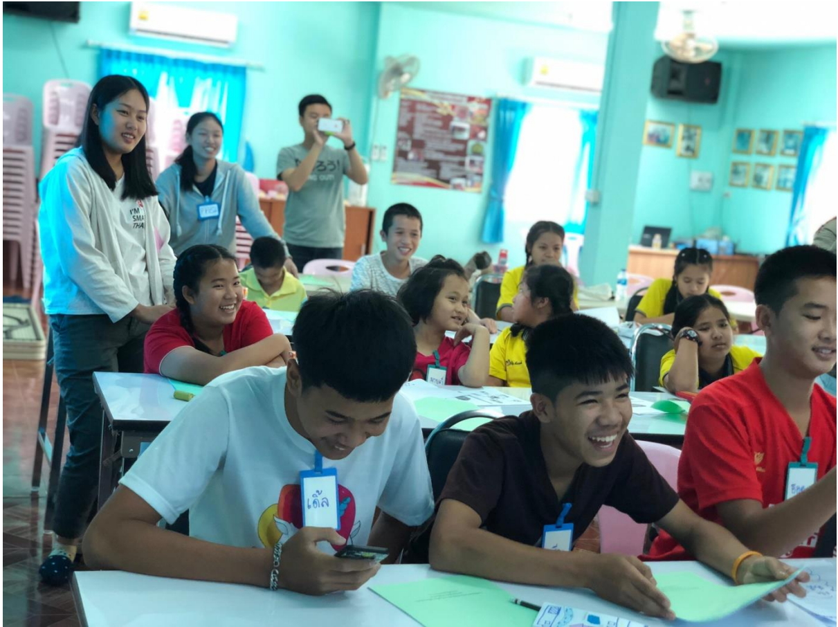
ตัวอย่างภาพผลงานของเด็กและเยาวชน